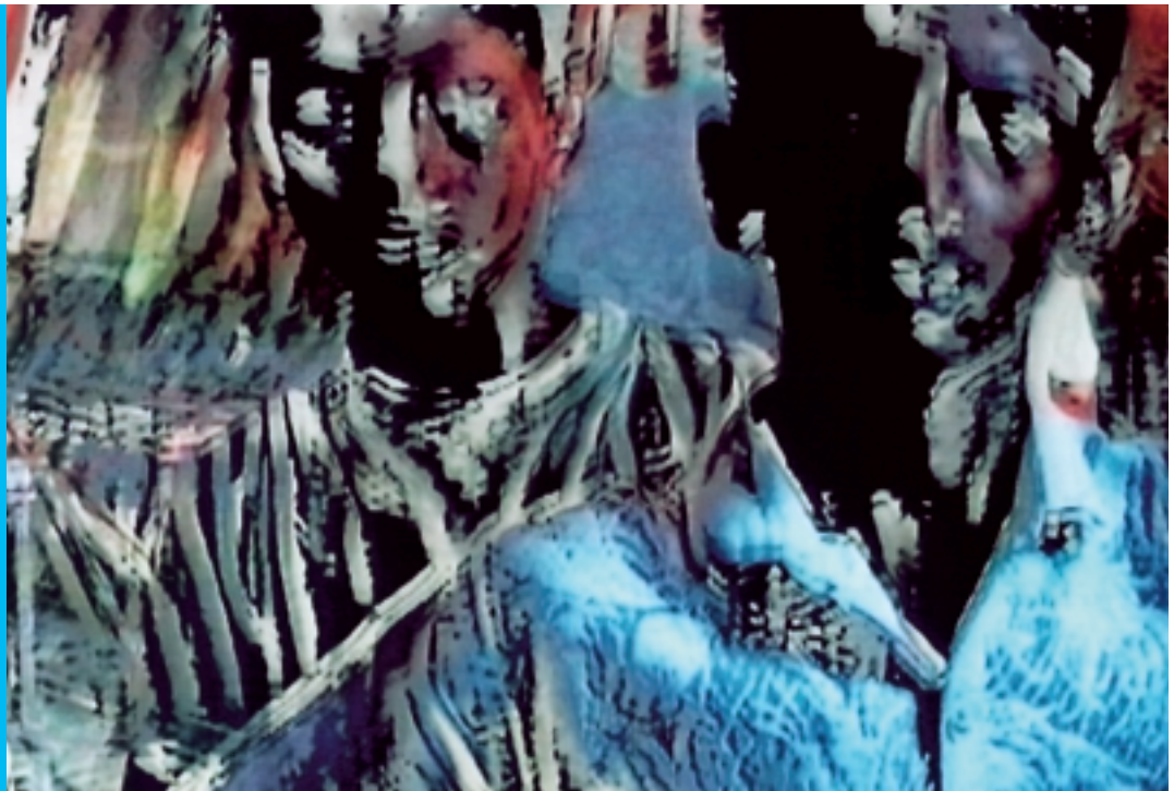
Cover: These Are Not My Images (neither there nor here)