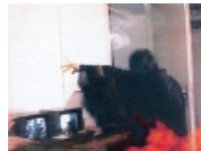
The Roman Wars