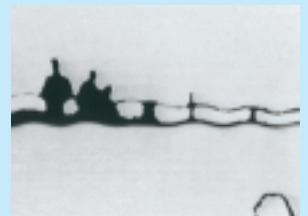
Leaving the Old Ruin