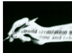
Leaving the Old Ruin