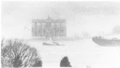
Study of a River