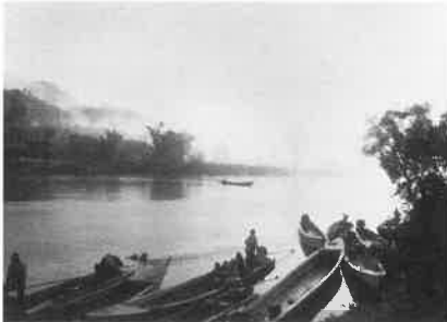
Images of Asian Music