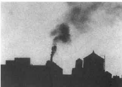
New York Portrait: Part I