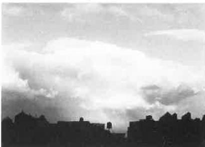
New York Portrait: Part I